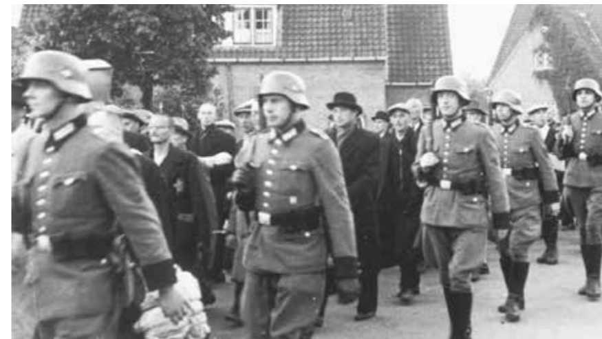
De tocht in Amersfoort van het station naar Kamp Amersfoort